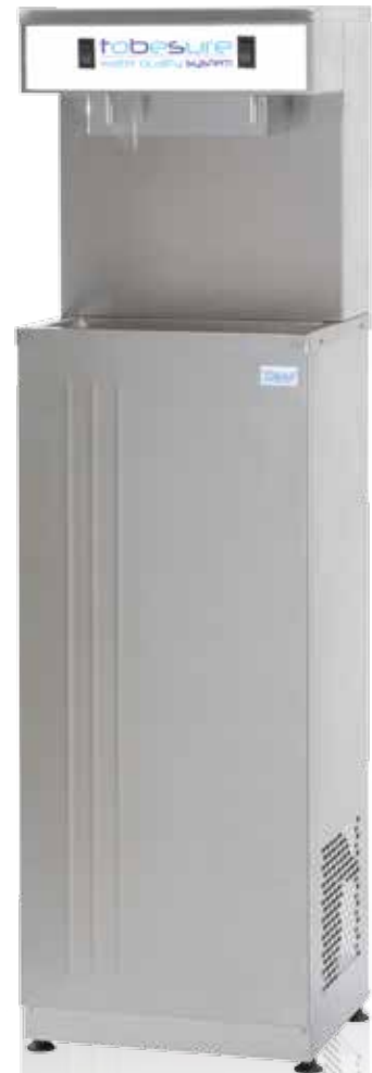
Coloris : Inox Colour : Stainless steel