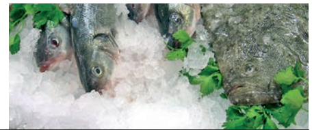
ICE FLAKERS | HIELO TROCEADO | GLACE À PAILLETTE

La carrosserie est entièrement en acier inoxydable AISI 304, facilement démontable. Il y a une ample gamme de bacs de stockage de glace marque ITV. La machine ICE QUEEN inclut une filtre à eau, une pelle et un distributeur de glace dans le bac. La machine est disponible en 220v/50Hz, 220v/60Hz, 115v/60Hz et triphasé 380v et réfrigérée par air ou par eau.