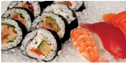
DRY ICE | HIELO SECO | PERLES OU GLAÇONS - ICE QUEEN 50C/85C

There is a full range of ITV storage bins to choose. The ICE QUEEN flaker comes complete with water filter, scoop and bin ice distributor. It is available in 220v/50Hz, 220v/60Hz, 115v/60Hz and triphase 380v and can be air or water cooled.