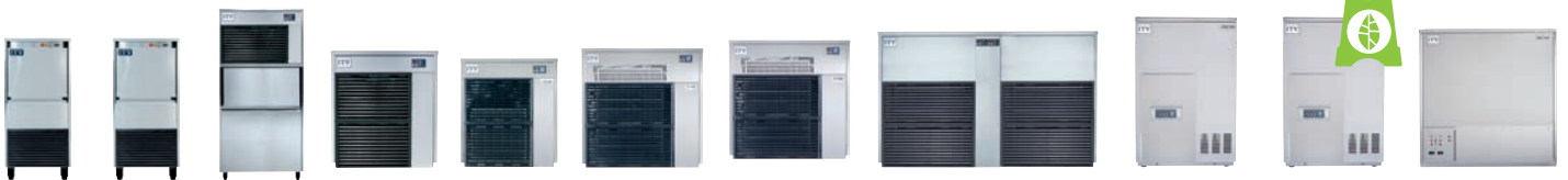
ICE QUEEN 50C ICE QUEEN 85C ICE QUEEN 135C