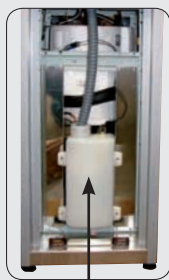
Jerrycan 2 litres intégré dans la fontaine en option*