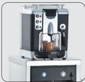
Possibilité de personnalisation

Dimensions : Hauteur totale = 1120 mm Largeur = 330 mm Profondeur = 330 mm Hauteur niche = 280 mm Sortie d'écoulement = 570 mm